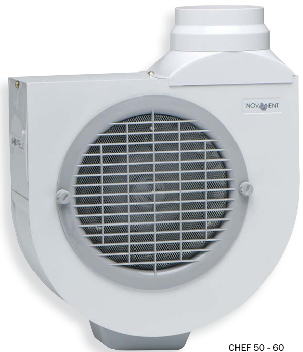
CHEF 50 - 60

Centrífugos para muebles de cocina Centrifugal extractors for kitchen furnitures Ventilateurs centrifuges pour meubles de cuisine Küchenabluft-Radiallüfter zur Installation in Küchenmöbeln